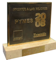
Premio Mejores Pymes 2008, en la categoría de Innovación. (Diciembre 2008)