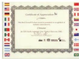
ISH North America Premio al Mejor Producto Innovación en la feria ISH North America (Octubre 2003)

Pero lo más valioso es que contamos con la satisfacción de miles de clientes que, como usted, buscan la calefacción perfecta.