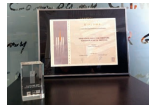
I Premio de Patentes de Asturias. otorgado por Centro Europeo de Empresas e Innovación (Mayo 2007)