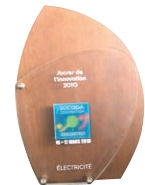
Premio Sacre Socoda al producto más Innovador (Febrero 2010)