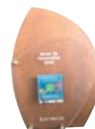
Premio Sacre Socoda al producto más Innovador (Febrero 2010)