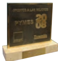
Premio Mejores Pyme's 2008, en la categoría de Innovación. (Diciembre 2008)