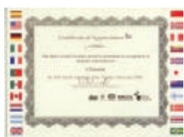
ISH North America Premio al Mejor Producto Innovación en la feria ISH North America (Octubre 2003)

Pero lo más valioso es que contamos con la satisfacción de miles de clientes que, como usted, buscan la calefacción perfecta.