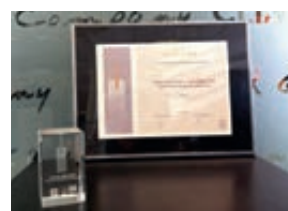
I Premio de Patentes de Asturias. otorgado por Centro Europeo de Empresas e Innovación (Mayo 2007)